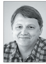
RAINER KEIL / DKP

http://www.linksfraktion-darmstadt.de/parlament/antrag/56/datenblatt.pdf