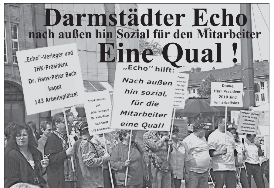
Demonstration der Beschäftigten gegen die neuen Pläne des DARMSTER ECHO

In den vergangenen Monaten wurden von Betroffenen und Mitgliedern eines gegründeten Solidaritätskomitees zahlreiche Unterschriften gesammelt, Infostände in der Innenstadt durchgeführt und an zwei Tagen mit Warnstreiks Druck gemacht. Zu einer Protestveranstaltung vor dem „Darmstadtium“ kamen ca. 200 Menschen. Der dort auftretende Oberbürgermeister versicherte den Beschäftigten seine Solidarität. Wir werden prüfen, ob außer schönen Worten auch konkrete Taten des Magistrats folgen werden.